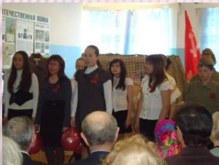
Музыкальная композиция ко Дню Победы