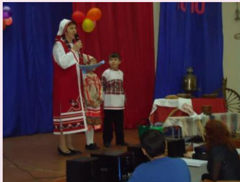
День государственности Удмуртии