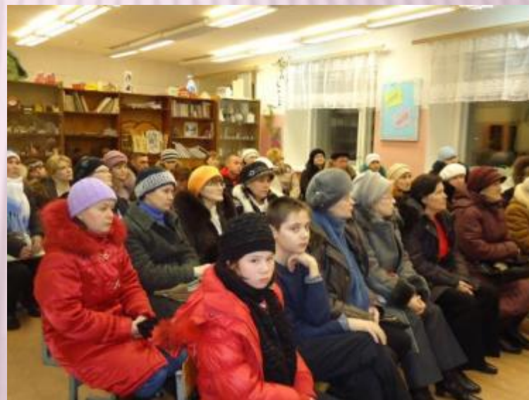
Родительское собрание «Здоровье ребенка – успех в учении»