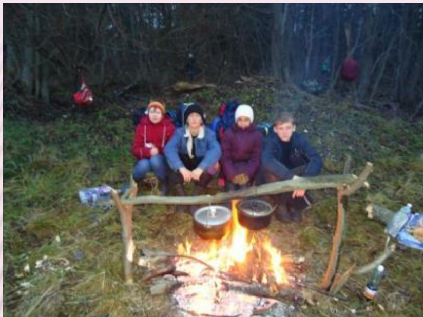
Туристско-краеведческий поход в деревню Почашево