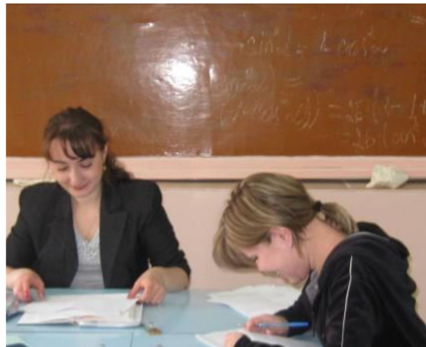
Готовимся к ЕГЭ