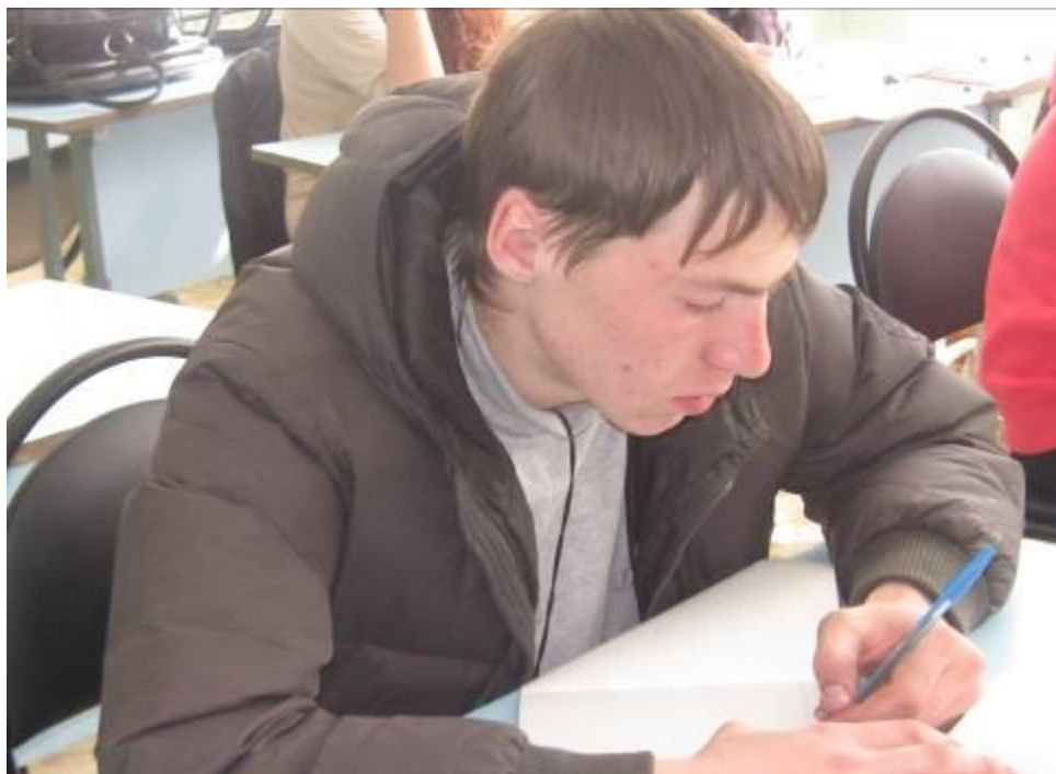
Классный час «Мой профессиональный выбор»